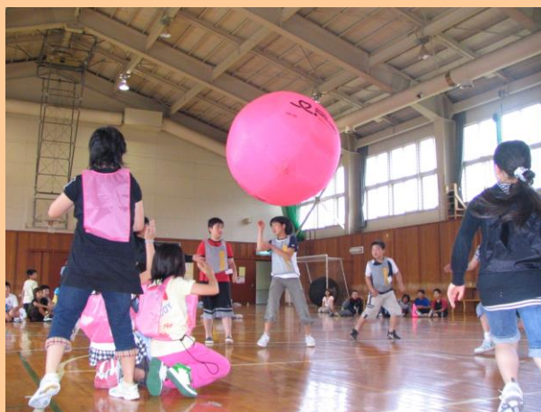
ニュースポーツ体験