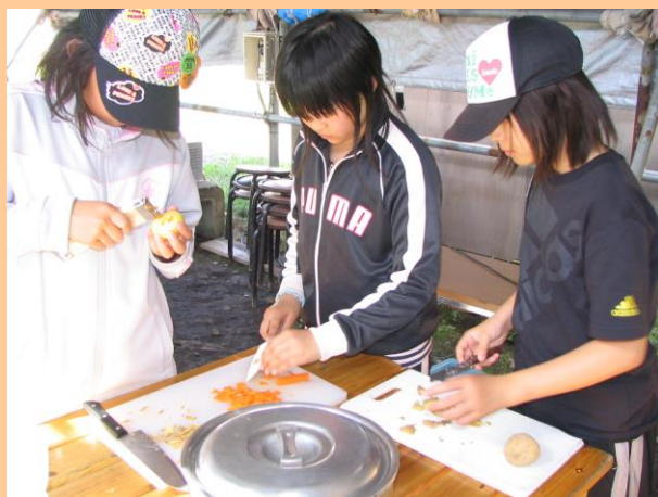
野外炊飯（カレー作り）